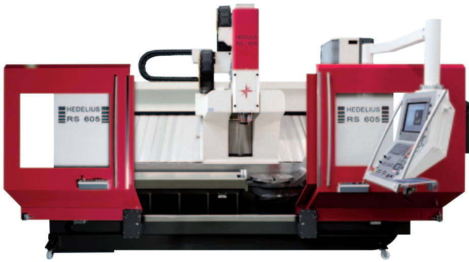
Het bewerkingscentrum met rechts de draaizwenktafel en links de vaste machinetafel

waren bij dit machineconcept aan het juiste adres." De RS 605 is namelijk geleverd met een standby-magazijn dat plaats biedt aan 190 gereedschappen met SK40, SK50 of HSK63 opnames. Proven Concepts heeft gekozen voor het optionele conus-reinigingssysteem dat tien posities in beslag neemt. Een geheel geautomatiseerde draaibare hefinstallatie met grijper neemt de gereedschappen uit het magazijn en plaatst ze in het magazijn van de machine. Het aan de achterzijde geplaatste standby-magazijn beschikt over een parallel besturingspaneel, zodat niet heen en weer gelopen hoeft te worden. Cornelissen: "We gebruiken de RS 605 onder andere om onze eigen gereedschappen te maken, onderdelen van meetmallen e.d. Complexe producten met vaak lange bewerkingstijden. Alles