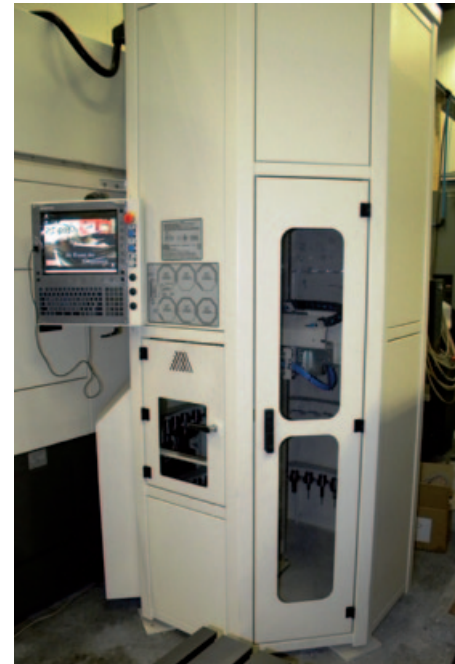
Het aan de achterzijde geplaatste gereedschapmagazijn biedt plaats aan 180 gereedschappen en een reinigingsunit en beschikt over een 'eigen', parallelle besturing