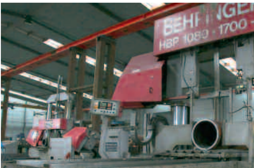
De 'HBP 1080' bandzaagmachine van Behringer bij Andi is uitgerust met Lenox bandzagen.

De Turkse bandzaagmachines die Andi voorheen in gebruik had waren uitgerust met vrije lichte motoren en reductiekasten. Deze machines waren evenmin voorzien van een voedingsreducering, en bleken onvoldoende performant. Momenteel wordt slechts één van die drie machines nog ingeschakeld in de productie, voor het onderhoek zagen. Zaakvoerder Tom Wydooghe: "Met de Behringer machines winnen we aan productiecapaciteit, zowel in aantal stuks als in de grootte van de stukken. De Lenox-medewerkers hebben enkele dagen lang testen bij ons uitgevoerd om zo tot de meest geschikte com-