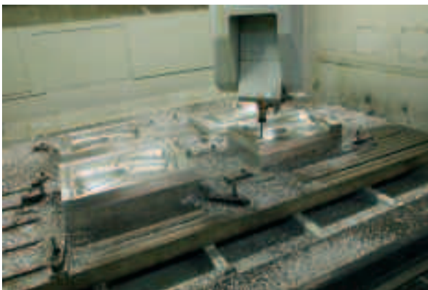
Omdat de capaciteit van deze machine zo groot is dat de tafel vrijwel altijd voor een deel vrij is, kan een dringend stuk al tussendoor gefreesd worden terwijl de andere stukken gewoon op de tafel blijven wachten.

►►► Je moet slim prioriteiten kunnen stellen," weet Ann De Feyter. Ofschoon ze de EIMA-machine in principe vanwege zijn stabiliteit en snelheid inzet voor het aluminiumfrezen, deinst ze er niet voor terug om ook hout, MDF of kunststof te verspanen op de nieuwe machine. "In principe hebben we onze drie portaalfreesmachines nu elk voor een eigen materiaal bestemd. Maar als het niet anders kan zullen we materialen wisselen. We kunnen niet wachten, want de klant geeft ons die tijd niet."