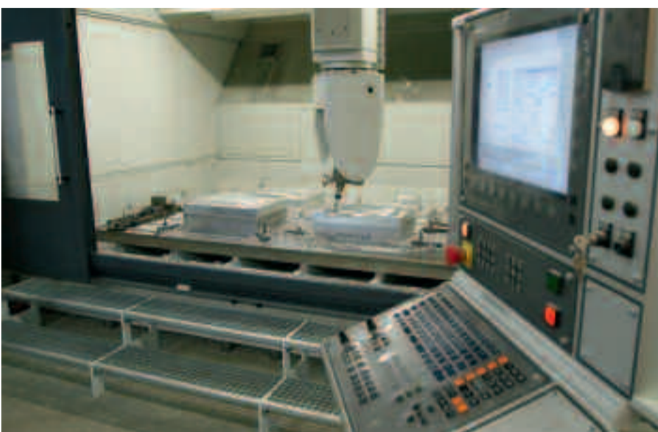
Door slim te combineren en prioriteiten te stellen, benut het bedrijf de voordelen van een portaal-freesmachine. De tafel biedt ruimte voor meerdere werkstukken zodat er altijd capaciteit gevonden kan worden voor spoedorders.

De Feyter maakt gieterijmodellen, het werk waar alles in 1922 mee begonnen is. Daarnaast produceert het bedrijf hulpstukken voor matrijzen en industriële modellen en prototypes tot meters lang als het moet. Er wordt hout verspaand, kunststoffen en ook aluminium. Sinds kort staat de EIMA naast twee oudere portaal-freesmachines: een 5-assige portaal-freesmachine met bovenliggende X-assen en een gesloten kast. Snelheid gecombineerd met freesnauwkeurigheid was de doorslaggevende factor in de motivering om in deze machine te investeren, vertelt Ann De Feyter. "Binnen de toleranties kunnen werken telt natuurlijk ook mee, maar bij ons is 0,1 mm nauwkeurigheid doorgaans voldoende. Snelheid vind ik veel belangrijker, want de reactietijden zijn vandaag de dag zeer