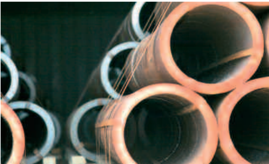
Met de nieuwe machine zaagt de Zeebrugse toeleverancier speciale flenzen voor applicaties in de petroleumindustrie.

binatie en een maximaal rendement te komen. Met de Behringer bandzaagmachine, uitgerust met een 'RX+' bandzaag van Lenox, kan constructiestaal met een diameter van 609 mm en een wanddikte van 25 mm gezaagd worden in pakweg 7,5 minuten. Met de oude machines nam dit ongeveer 45 minuten in beslag. We zagen dus zes keer sneller dan voorheen. Met de nieuwe machine zagen we speciale flenzen voor applicaties in de petroleumindustrie. In dit marktsegment moet er zeer kort op de bal gespeeld worden. Een bestelling van bijvoorbeeld 1.800 stuks die vandaag binnenkomt moet binnen enkele weken worden geleverd. Daarom hebben wij heel wat buizen op voorraad."