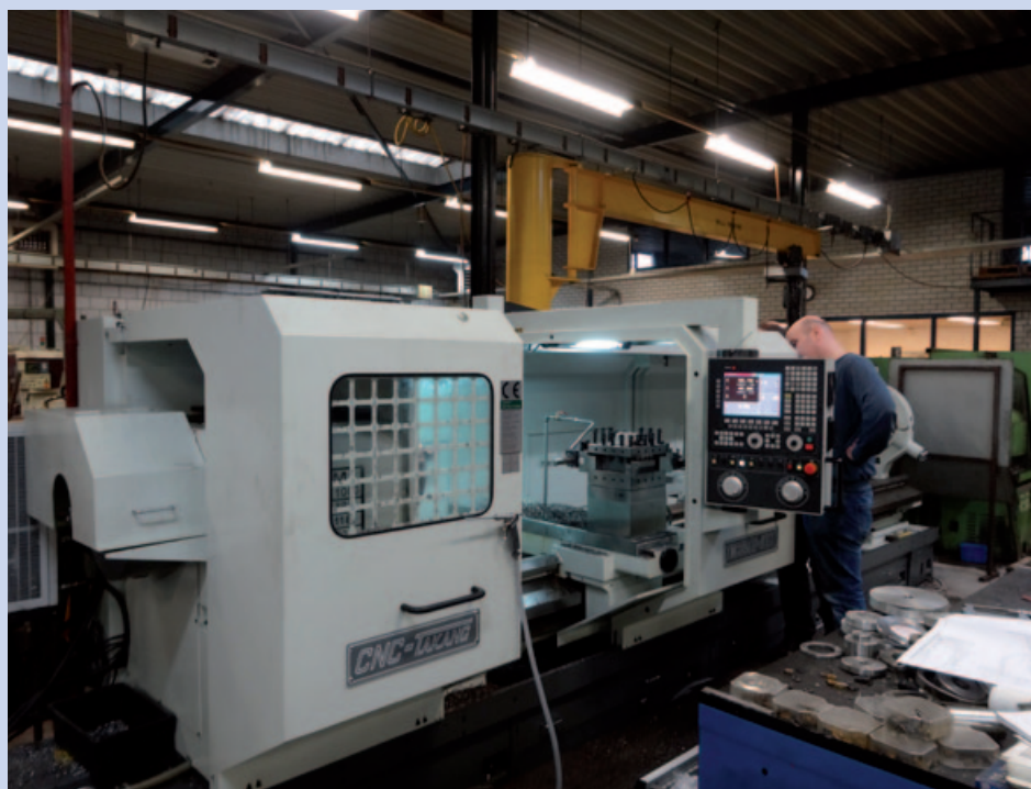
De Takang TNC890A stelt Hamers Metaalbewerking in staat om werkstukken met een lengte van 4 m en een diameter tot 900 mm te bewerken. Met deze capaciteitsuitbreiding kan Hamers nieuwe klanten en aanvragen werven

bank uit laten voeren met een grotere doorlaat van 155 mm in plaats van de 103 mm die standaard wordt geleverd. Verder heeft de Takang een vierslags-turret en is het tegencentereenvoudig te verplaatsen. Bijzonder is de gereedschapshouder die Hamers zelf heeft ontwikkeld. Met deze oplossing kunnen er acht gereedschappen binnen 0,001 mm opgespannen worden, waardoor een snelle en nauwkeurige gereedschapswissel mogelijk is. De TNC890A is voorzien van een 22 kW motor en behaalt een maximaal toerental van 1.000 min -1 . Hiermee kunnen werkstukken met een omloopdiameter tot 900 mm bewerkt worden.