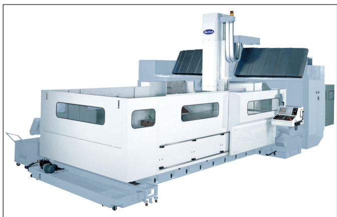
Voor het verspanen van grote delen levert Promas onder meer deze portaalfreemachine van Hartford.

Groot verspaning vergt specifieke kennis van de machines: van complexe koppen, aandrijfsystemen tot motorspindels. Maar om tot een goed advies voor de klant te komen, is ook kennis van het