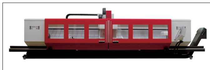
Hedelius is nog altijd een van de weinige machinebouwers met het bijzondere pendelconcept, waardoor efficiënt verspanen mogelijk is.

kunnen we onze klanten optimaal adviseren en hoeven we ze niet in een bepaalde richting te duwen omdat we anders geen alternatief hebben." Inmiddels zijn ook van de grotere machines praktisch allemaal referenties beschikbaar in Nederland of het Duitse Roergebied. Promas levert voor al deze machines passende automatiseringsoplossingen. Voor de kleinere machines worden die deels in eigen huis ontwikkeld. "Wij kunnen zo'n project turn key opleveren, zodat de klant alleen ons als aanspreekpunt heeft", legt Hermans uit. Bij de machines voor het groot verspanen ligt de uitvoering dik-