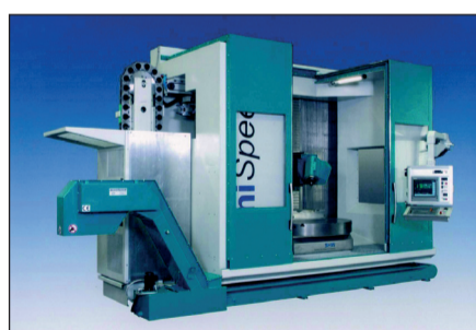
SHW heeft op de laatste EMO de compacte UniSpeed 5 gelanceerd, met zowel onder als boven een begeleiding voor meer nauwkeurigheid.

Hedelius is nog steeds een van de weinige fabrikanten met een vertikaal bewerkingscentrum in vast bed, lang bed of pendeluitvoering. Maximale stabiliteit en precisie gaan samen met flexibiliteit. Uit de stal van EiMa levert Promas 5-assige hogesnelheids portaalfreemachines, speciaal voor de model- en vormenbouw. En van de Spaanse fabrikant MTE levert men bedfreemachines. De Duitse fabrikant Union biedt machines in veel verschillende uitvoeringen, waaronder een serie met wisseltafel maar ook een machine (PCR 160 Plus) voor het boren in een oppervlak van 6 bij 25 meter!