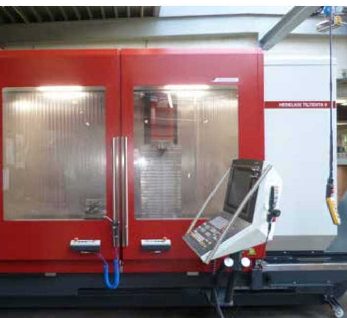
Metaaldraaij Moerenhout investeerde in een nieuw vijfassig bewerkingscentrum type TILTENTA 9-2600 1R van Hedelius.