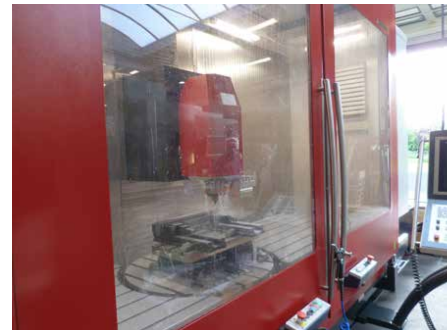
Dit systeem omvat een zwenkbare freeskop met snelheden tot 14000 toeren/minuut. De bereikbaarheid van de tafel is optimaal dankzij de ergonomie van deze Hedelius.