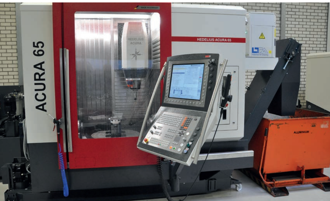
De Acura 65 van Hedelius bij Dynobend.

Dynobend werd in juni 2016 onderdeel van de Stichting Nivora Groep, waartoe ook SafanDarley, Style CNC Machines en Bewo Cutting Systems behoren. "Dankzij Nivora hebben wij de mogelijkheid gekregen om op alle fronten te investeren en te moderniseren. Onze medewerkers hadden terecht al vaker gevraagd om een nieuwe machine. We zijn in de buurt langs geweest bij collega-bedrijven met Acura 65's en die waren er laaiend enthousiast over." Vanwege zijn compactheid en precisie is het bewerkingscentrum zeer populair in Nederland. De machine is uitgerust met een dubbelgelagerde draai-zwenktafel en een bewegende kolom en is vooral geschikt voor efficiënte, snelle bewerking van complexe producten. Proost: "De Acura 85 is iets groter, met een groter bed, maar die is ook duurder terwijl de precisie hetzelfde is, dus onze voorkeur lag al snel bij de 65."